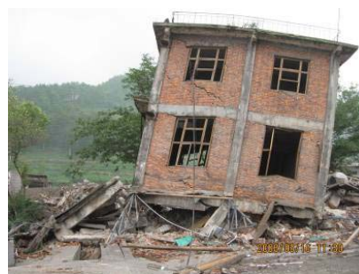
红白镇底框砖混加油站