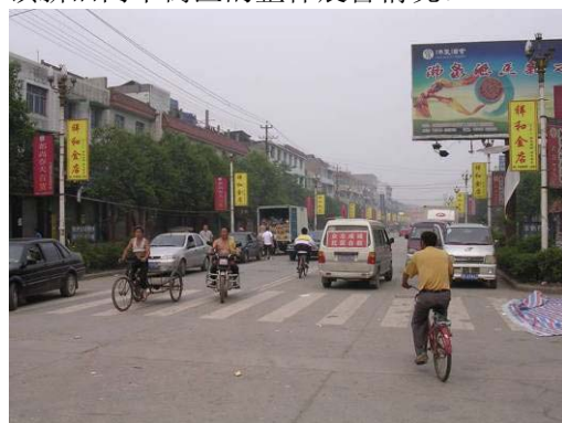
图 2 安县秀水镇新街道震害