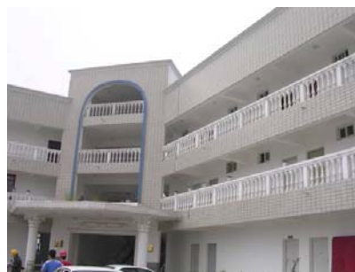
绿天电动源有限公司办公楼