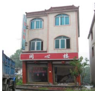
小鱼洞镇某底框砖混结构的底框侧移变形