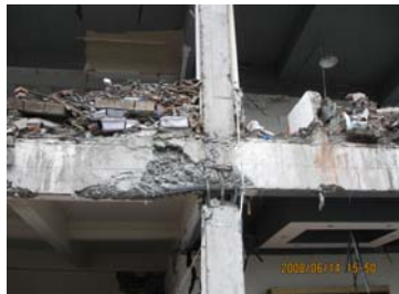
都江堰某住宅框架出现柱铰