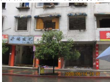
都江堰魁光街临街面

对于框架-砌体水平混合结构,由于结构体系混乱,在地震作用下框架和砌体承重墙抗侧力构件的刚度和变形能力不协调,框架部分与砌体结构部分受力复杂,极易导致严重破坏。图7为框架-砌体水平混合结构的震害情况。框架-砌体水平混合结构的大量存在,不仅仅是这次地震受影响区域的局部问题,而是在我国西部地区具有一定的代表性,近年来西部地区的几次地震都反映出类似的问题,应该引起重视 [4] 。