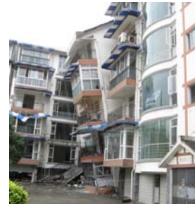
都江堰某住宅框架结构底层坍塌