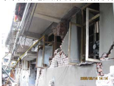
都江堰魁光街背街面