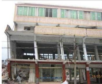
南坝镇某框架结构出现柱铰机制破坏

本次地震中,大多数框架结构的主体结构震害一般较轻,尽管如此,震害调查显示,框架结构的柱端出铰、柱端剪切破坏、节点区破坏等现象比较常见,见图8。这些震害表明,现行设计规范 [5] 中要求柱铰机制机制的破坏模式没有实现,“强柱弱梁、强剪弱弯、强节点弱构件”等设计理念没有实现。在强柱弱梁方面,由于框架梁跨度过大使得其截面尺寸增大、楼板对框架梁的刚度和承载力贡献、建筑需要在框架梁的砌体或填充墙的刚度增强作用,规范对框架柱的轴压比限值过高使得框架柱的截面尺寸偏小等,使得框架梁或屋盖的实际刚度增大,在实际框架结构震害中,很少看到“强柱弱梁”型破坏。