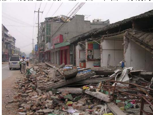
图 1 安县秀水镇旧街道震害

相反, 89 抗震规范以前的建筑震害明显较重, 特别是大量为采取抗震措施的砖混结构, 在这次地震中震害十分严重。另一方面, 村镇建筑和农民自建住宅, 由于缺乏必要的抗震知识和必要的技术指导, 加之年久失修, 震害也比较严重。图 1 和图 2 分别为安县秀水镇新旧两个街区的整体震害情况。