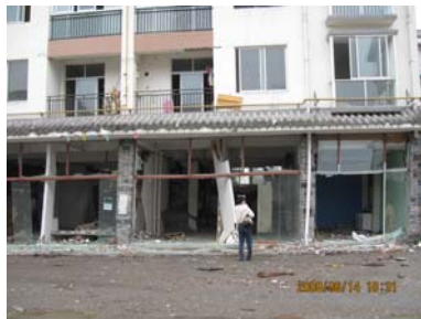
都江堰某住宅框架结构底层侧移严重