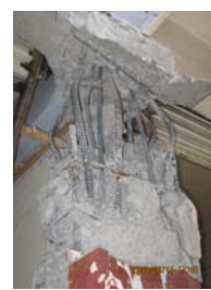
都江堰某框架柱塑性铰剪切破坏