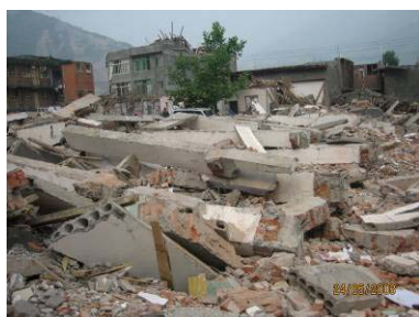
南坝镇小学教学楼垮塌