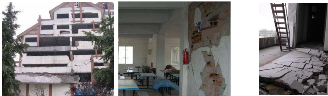
都江堰市某建筑填充墙破坏

另外,框架结构的围护结构和填充墙发生明显的震害,见图 9。这虽然不属于主体结构的破坏,但仍然会对人员安全造成威胁,同时也造成很大的财产损失,使灾后修复与重建成本大大增加,尤其是对住户的心理造成严重恐慌,不利于震后恢复正常生活和工作的开展。从性能化设计的角度出发,对填充墙、女儿墙、建筑外立面装饰材料等非结构构件也应进行相应的抗震性能和抗震安全的研究,并在性能化抗震设计的基础上,对非结构构件的抗震设计给出具体的规定。