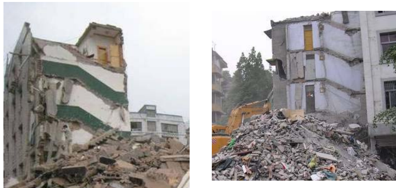
某建筑物从楼梯间处断开

震害调查发现,楼梯间、悬挑走廊等灾后逃生通道的震害普遍较为严重。在现浇框架结构中,现浇楼梯的破坏主要集中在跑板或跑梁跨中断裂,填充墙开裂严重;而在采用预制钢筋混凝土梁式楼梯或板式楼梯的住宅结构中,楼梯梯板与两端支座连接处拉开,楼梯间与结构其它部分完全分离。如图 10 所示。