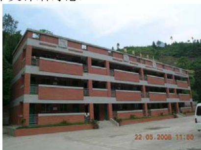
江油县雁门镇明德小学

然而震害调查中同时发现,一些按规范认真设计、结构形式和抗震构造措施合理的砖混结构房屋,抗震性能满足设防要求,见图 5。事实上,1976 年唐山地震以及上世纪末我国西部地区的多次地震震害都表明 [1][2][3] ,砖混结构中的现浇钢筋混凝土圈梁、构造柱对于结构在地震中保持整体性,避免发生整体倒塌具有非常重要的作用,特别是构造柱的作用尤为重要。只要构造措施得当,砖混结构完全可以实现预期的抗震设防目标。这次地震却重蹈了唐山地震惨烈震害的覆辙,很多是在结构体系和设计方面存在问题,具体原因将在下文详细讨论。