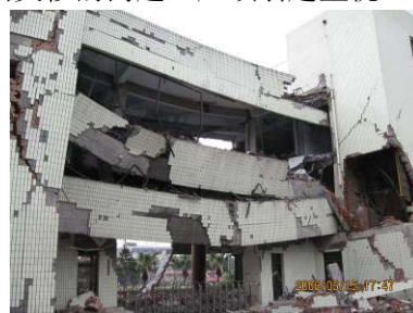
绵竹某办公楼倒塌