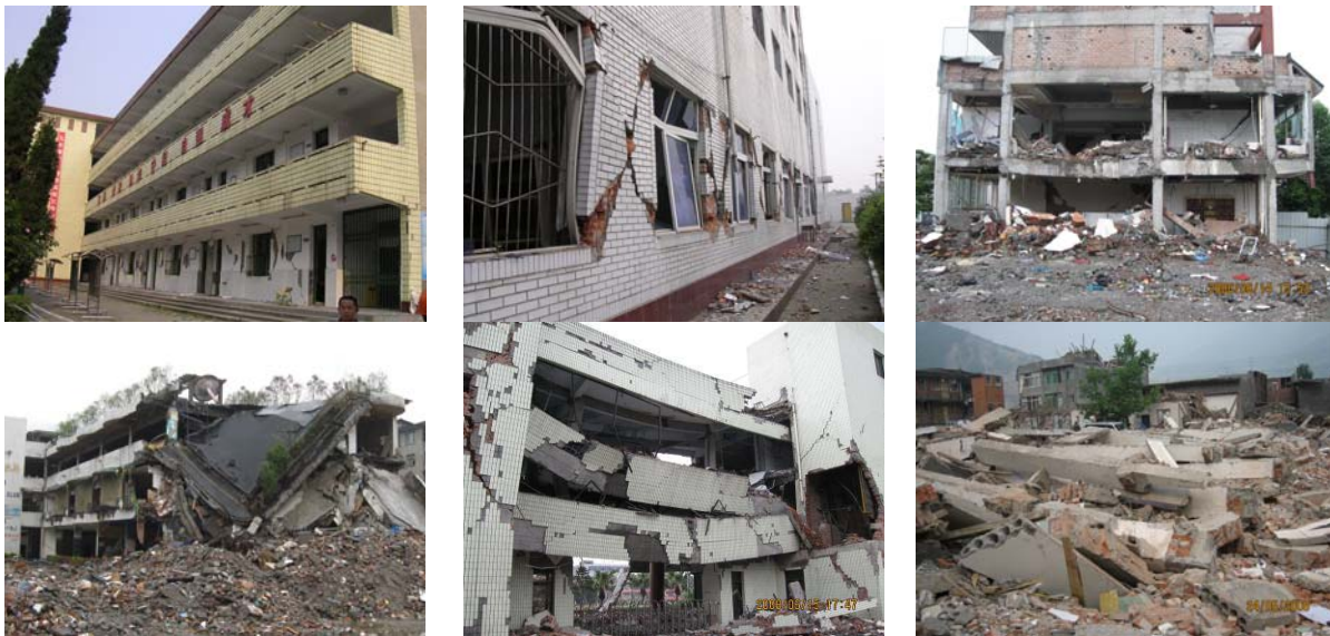
图12 “大震不倒设计点”C点以后不同破坏程度的建筑震害

图12为作者在这次汶川地震调查中收集到不同破坏程度的建筑震害状况。显然，这些建筑震害状况已超过抗震规范的“大震设计点”，有些并未倒塌，而有些则倒塌。尽管超过“大震设计点”可能也会造成一定的人员伤亡，但比彻底倒塌的人员伤亡要小很多。如前所说，“大震设计点”后结构系统的抗震性能主要取决于结构系统的鲁棒性、整体稳定性和整体牢固性，也即结构系统“倒塌点D”与“大震设计点C”之间的“意外安全储备”大小。因此，增强结构系统的鲁棒性、整体稳定性和整体牢固性，是提高结构的抗倒塌能力具的基本思想。