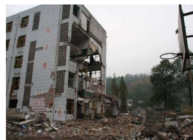
荇华中学教学楼右段倒塌 (左段为框架结构)