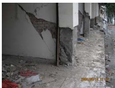
龙门山镇底框砖混结构底框柱和墙破坏