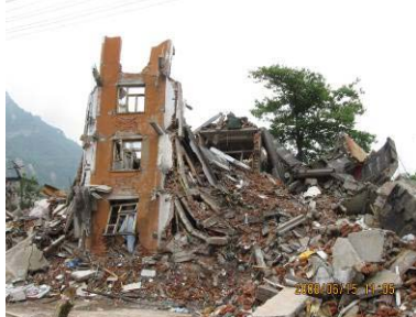
汉旺镇铁路货运站宿舍楼倒塌