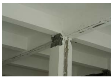
绵阳某框架柱顶出现塑性铰